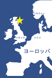
アバディーン的位置

私たちは石炭と石油・ガスを生むまちとしてのつながりにより、2018年から市民同士で交流しています。