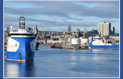
アバディーンのみちなみ